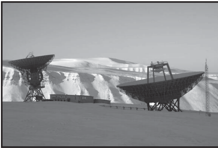
Das europäische Äquivalent zu HAARP heißt Eiscat und dient offiziell der Hochatmosphären- und Ionosphärenforschung. Konspirativisten zufolge strahlt dieser sich über etliche Länder spannende Sendeanlagenverbund über Frequenzen, die von Mobiltelefonen empfangen werden können.