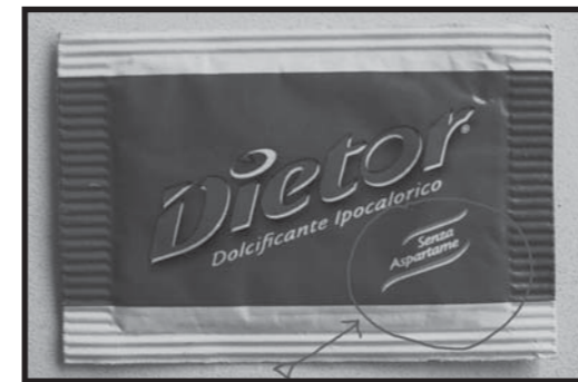
Mancherorts scheinbar auch für die Lebensmittelindustrie schon ein Thema: Süßstoff ohne Gehirnweichspüler und Fettgürtelanzüchter.

Warum Aspartam jemals den Weg in die Nahrungsmittelindustrie gefunden hat, ist ein höheres Rätsel - wenn auch klar ist, dass wir dies einem gewissen Donald Rumsfeld zu verdanken haben. Handelte es sich doch um einen die längste Zeit von der CIA favorisierten biochemischen Kampfstoff, der vor allem zerebrale Schäden, die bis zu einer Art unechter Multipler Sklerose führen können, herbeiführt. Ganz abgesehen davon, dass Aspartam die Bildung von Fettzellen anregt und genau deswegen auch in der Schweinezucht eingesetzt wird und von daher als Diätetikum gänzlich ungeeignet ist.